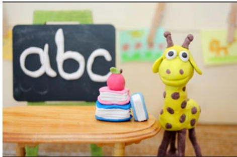
Wir lernen „Giraffisch“