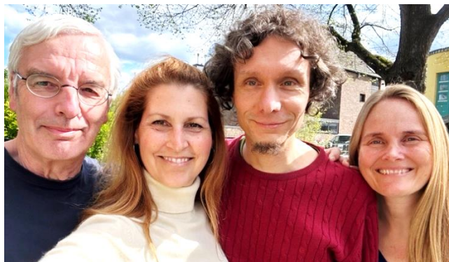
Trainer:innen- und Assistent:innen-Team

Diese Trainer:innenausbildung ist als Bildungsurlaub anerkannt und eignet sich auch als Baustein für Menschen, die sich auf den Weg der Zertifizierung als Trainer:in für Gewaltfreie Kommunikation begeben möchten.